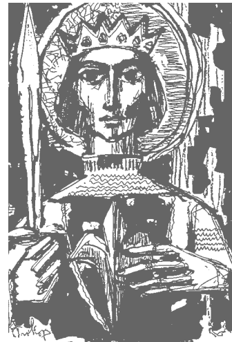
Szent Imre herceg (november 5.)

Életszentségének egyik előmozdítója szülei példás élete volt. A másik, nevelőinek életszentsége. Amikor a mai fiatalság állapotán kesergünk, talán legelőször a szülői és a pedagógusi eszmény helyreállításán kellene gondolkodnunk. (Papp Tamás.)