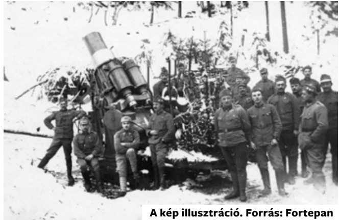
A kép illusztráció.

Katakombákba száll a gondolat... Mélyben, sötétben rejtőzködve mint én, A vértanúk így jöttek össze szintén Dicsérni a ma született Urat.