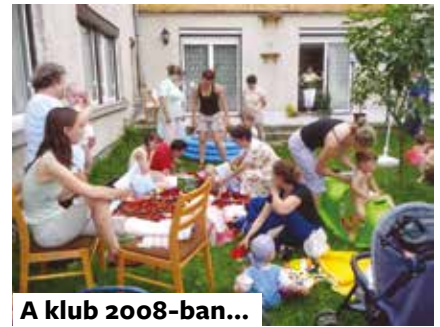
A klub 2008-ban...