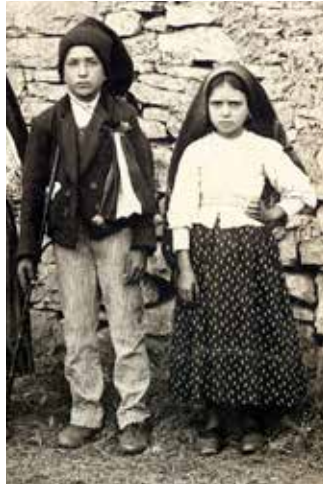
Francisco és Jacinta Marto

(Forrás: http://www.kath.net/news/59386 )